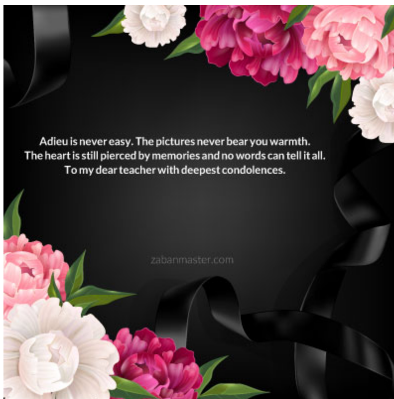
تسلیت برای درگذشت معلم به انگلیسی

I'm simply saddened. I would definitely miss this great person's presence.